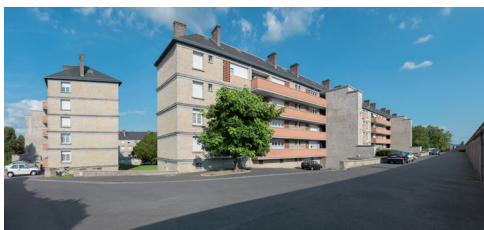
Cité du Parc, Nevers. Emile Berthelot

L'étude des canaux de Bourgogne a également été l'occasion de se confronter à l'absence d'un vocabulaire normalisé pour certains ouvrages hydrauliques et techniques. Les maisons éclusières standardisées se sont avérées plus facile à décrire.