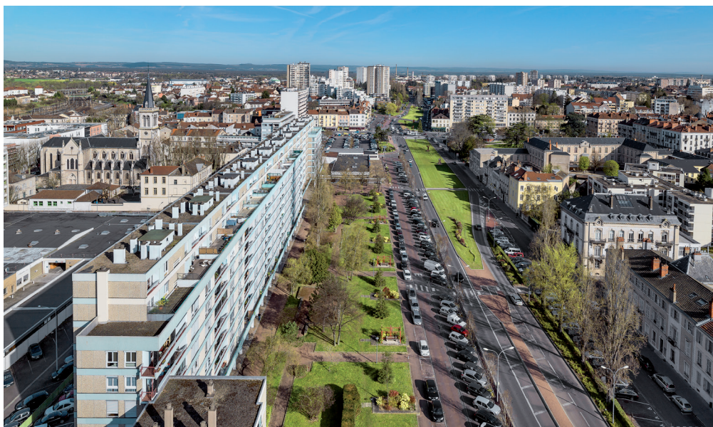
Barre du canal, avenue Nicéphore Niepce, Chalon-sur-Saône sous la direction de Daniel Petit architecte.

Il convient effectivement de faire la distinction entre des termes généraux comme « grand ensemble » et les termes qui possèdent une définition précise, mais trop souvent méconnue. Ainsi l'acronyme ZUP, procédure possédant un cadre juridique