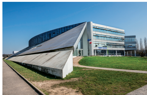
Façade d'entrée et angle nord-ouest du bâtiment socio-éducatif, lycée Gustave Courbet, Belfort. Jean-Pierre Drezet. Cliché : Yves Sancey, 2009.

Pour l'inventaire des lycées en Franche-Comté, si les édifices de la première moitié du XXe siècle pouvaient être décrits avec le vocabulaire existant, il en allait autrement pour les plus récents, avec notamment des plans aux articulations entre les différents bâtiments plus complexes.