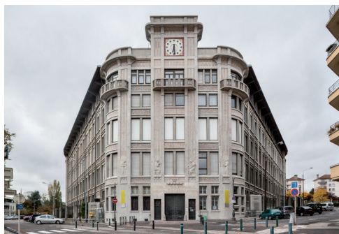
Lycée polyvalent Jules Haag, Besançon. Paul Guadet, André Boucton Cliché : Mary Ruffinoni, 2014.