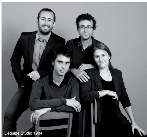
L'équipe Studio 1984

Un désir de maison en bois pour une résidence secondaire et plus tard principale, un contact avec une agence d'architecture pris sur le Salon de l'habitat... Le dialogue s'engage entre le futur propriétaire et Studio 1984, agence qui a déjà réalisé des maisons à ossatures bois et se soucie de mettre en œuvre des matériaux locaux. Ce dialogue donne corps en 2016 à une maison singulière qui attire les regards au sein du paysage ligérien.