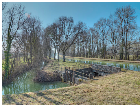
Le contre-fossé rejoignant la Brionne avant son passage sous le canal de Bourgogne au moyen de l'aqueduc visible au premier plan. Bief 12 du versant Yonne à Eguilly. Daniel Petit. 2012.

À l'image de cet exemple, le futur livre sur le vocabulaire architectural du XXe siècle, auquel travaille actuellement la mission Inventaire du ministère de la Culture et de la Communication en lien avec les services régionaux, devra donc présenter des termes précis et aux définitions suffisamment larges pour être employées par l'ensemble des chercheurs.